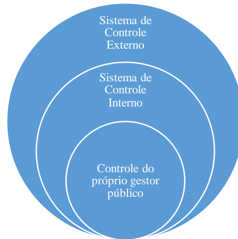
Figura 1 - Inter-relação das instâncias de controle institucional