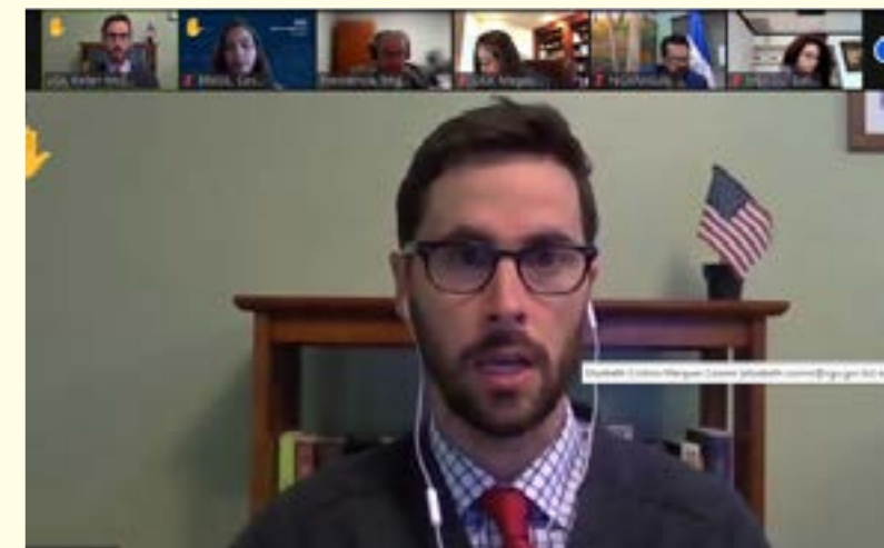
Representantes de diversos países em reunião virtual do Mesicic

Também chamou a atenção, no relatório do México, o reconhecimento como boa prática do "Padrón de Integridad Empresarial en materia de Ética e Integridad" , iniciativa semelhante ao programa Empresa Pró-Ética, em que se reconhecem empresas voluntariamente