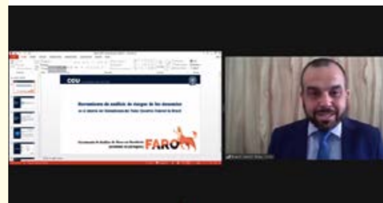
Valmir Dias apresenta o FARO como boa prática

A CGU, representada pelo ouvidor-geral da União, Valmir Dias, apresentou o FARO – Ferramenta de Análise de Risco em Ouvidoria. A iniciativa, que é resultado da ação 35 do Plano Anticorrupção , utiliza o cruzamento de dados automatizados para atribuir pontuação às denúncias recebidas no Fala.BR, empregando técnicas de machine learning , de modo a priorizá-las, de acordo com o grau de relevância e a probabilidade de habilitação para apuração. Além do Brasil, diversos outros membros apresentaram iniciativas. Um resumo das apresentações realizadas está disponível no perfil oficial do Mesicic no Twitter .