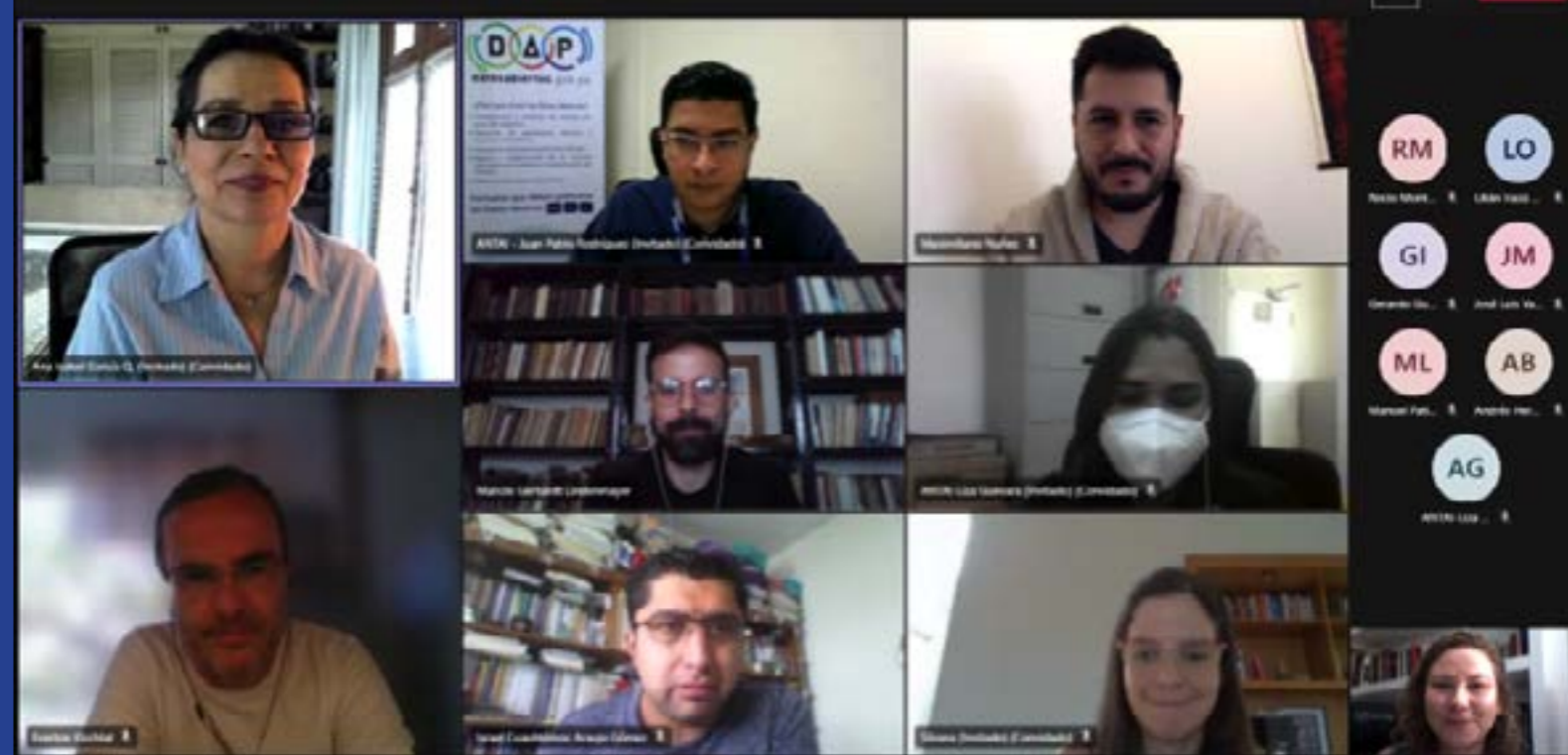
Participantes do Workshop sobre o Direito de Acesso à Informação para os Grupos em Situação de Vulnerabilidade

O evento contou com a participação dos representantes da CGU, por meio da Ouvidoria-Geral da União; do Instituto Nacional de Transparencia, Acceso a la Información y Protección de Datos Personales do México ; do Consejo para la Transparencia do Chile ; do Instituto de Acceso a la Información Pública de El Salvador e da Autoridad Nacional de Transparencia y Acceso a la Información do Panamá .