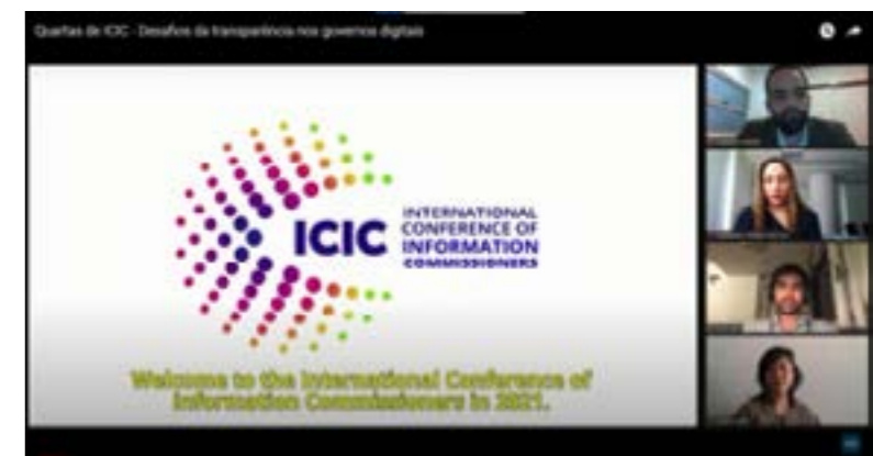
ICIC dá as boas-vindas aos participantes do webinário

para superar tais riscos pela abertura dos algoritmos e das bases de dados em portais governamentais, pela adoção de algoritmos explicáveis e auditáveis, permitindo maior controle social.