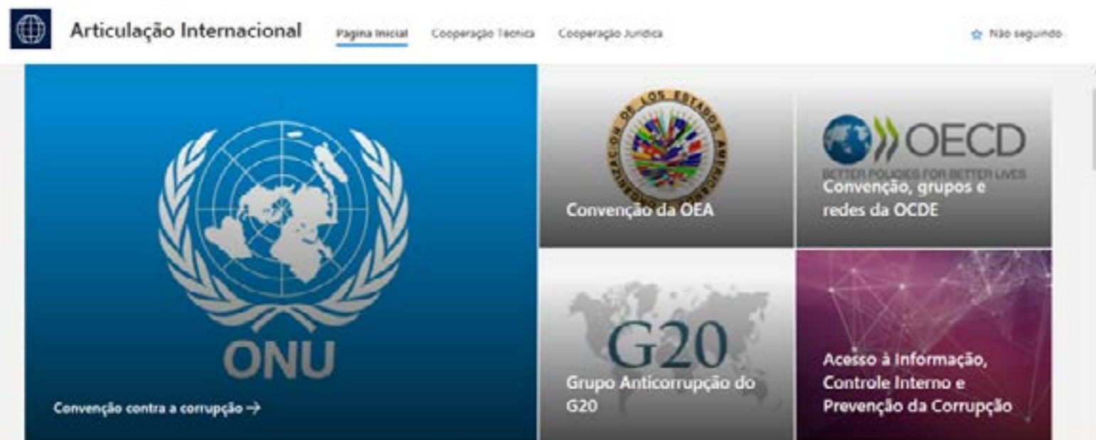
Página inicial da Articulação Internacional na IntraCGU

O novo espaço reúne informações sobre as atividades internacionais em diversas linhas de atuação