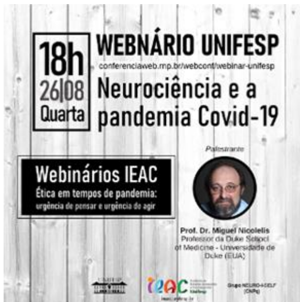
Webnário UNIFESP: neurociência e a pandemia Covid-19