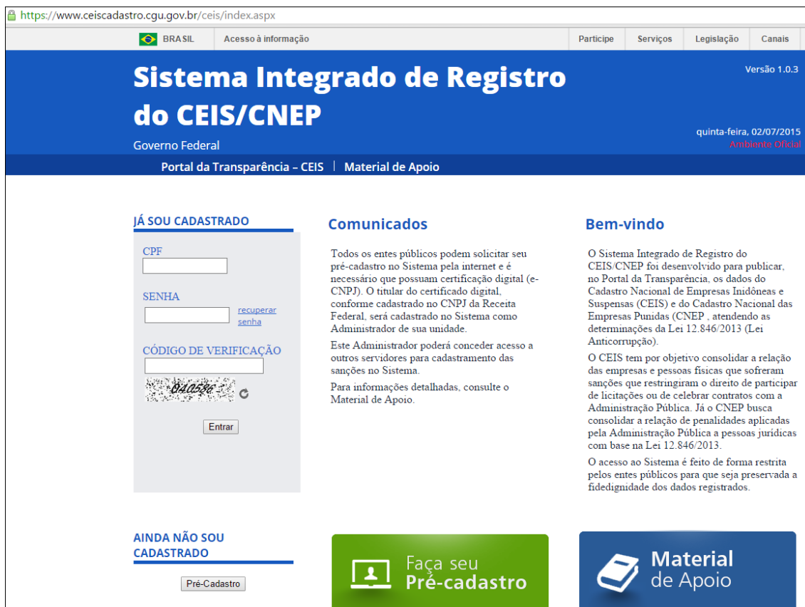
Tela inicial do Sistema.

Em resumo, o fluxo de alimentação do CEIS e do CNEP é o seguinte: certo órgão ou entidade aplica uma pena contra pessoa jurídica (digamos, impedimento de contratar). Esse mesmo órgão acessa o Sistema e lá cadastra esse impedimento. A seguir, dentro de poucas horas, essa penalidade já será publicada no Portal da Transparência.