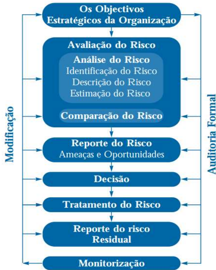
Figura 1 Processo de gestão de riscos segundo FERMA (2002).

Assim sendo, o processo de gestão de riscos pelo FERMA está esquematizado na figura a seguir: