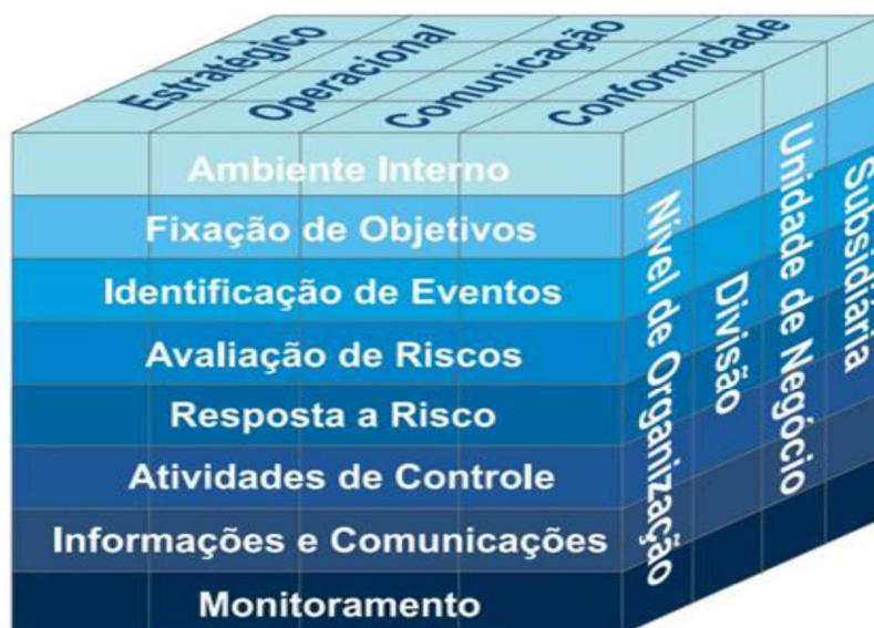
Figura 2 Estrutura conceitual do COSO (2009).

Em junho de 2016, o COSO revisou o modelo de 2004, por meio do novo documento intitulado “Alinhando Risco com Estratégia e Desempenho”, para destacar a importância do gerenciamento de riscos relacionado tanto à estratégia quanto ao desempenho da organização. A atualização do modelo ofereceu uma perspectiva sobre conceitos e aplicações atuais bem como os conceitos em processo de evolução no âmbito do gerenciamento de riscos corporativos.