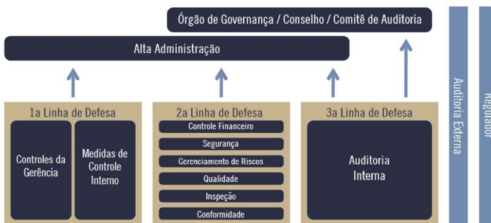
Figura 4 Modelo das três linhas de defesa. IIA, 2013