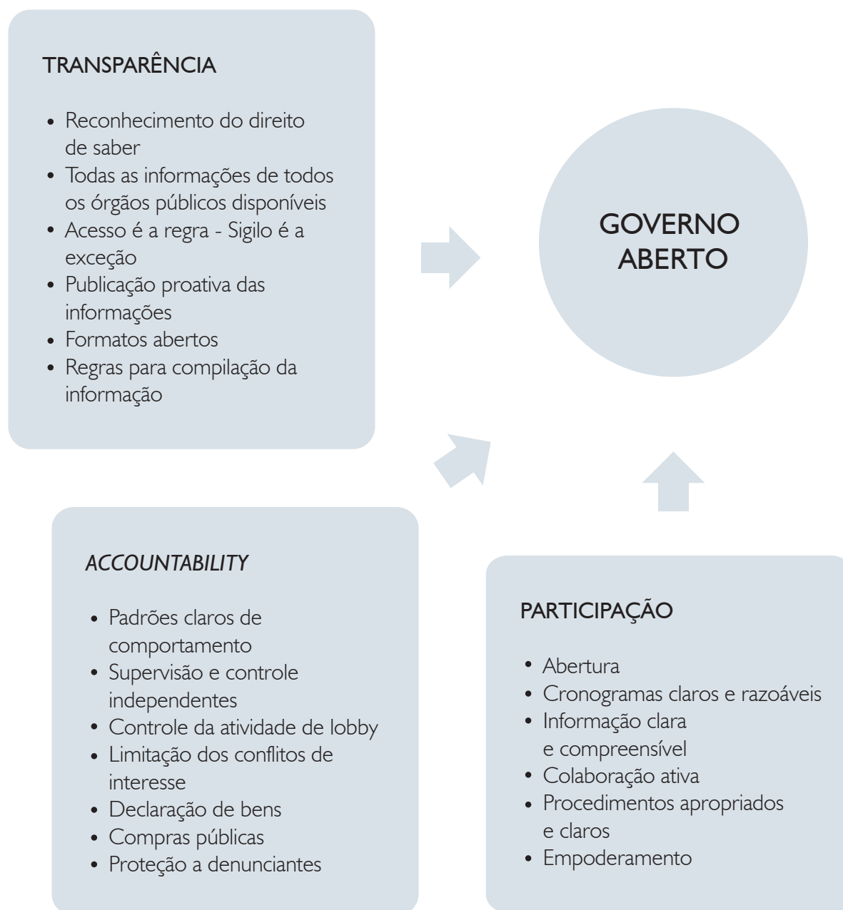
Figura 1 - Condições para Governo Aberto

Fonte: Adaptado de OpenGov Standards 2012, Prieto-Martín, 2014 3