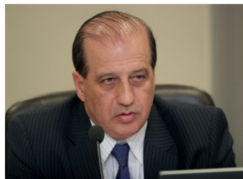
Ministro do Tribunal de Contas da União, Augusto Nardes.

“Com isso, o alcance de resultados almejados por cada uma dessas organizações passou a estar mais vulnerável. De forma simples, podemos definir risco como a probabilidade de algo não dar certo. A gestão de riscos compreende as ações adotadas em nível gerencial e estratégico para a identificação e prevenção dos fatores que podem impactar negativamente as atividades relevantes das organizações. Desse modo, é possível uma atuação preventiva para evitar ou mitigar a ocorrência