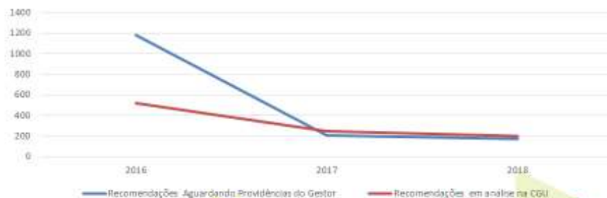
Gráfico Demonstrativo dos Resultados da Implementação da Política de Redução de Recomendações Pendentes de Resposta entre os Gestores do MAPA e a CGU