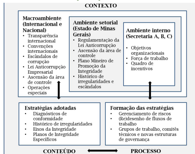
FIGURA 1. QUADRO DE PETTIGREW SOBRE ASPECTOS DE CONTEXTO, CONTEÚDO E PROCESSOS DA INSTITUCIONALIZAÇÃO DE AÇÕES PRÓ-INTEGRIDADE PÚBLICA