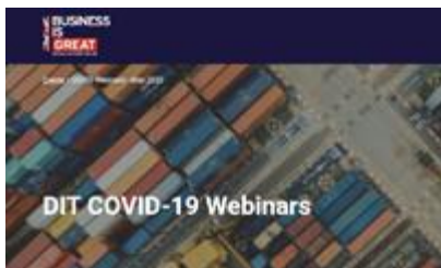
Basel Institute on Governance – UK June Webinars