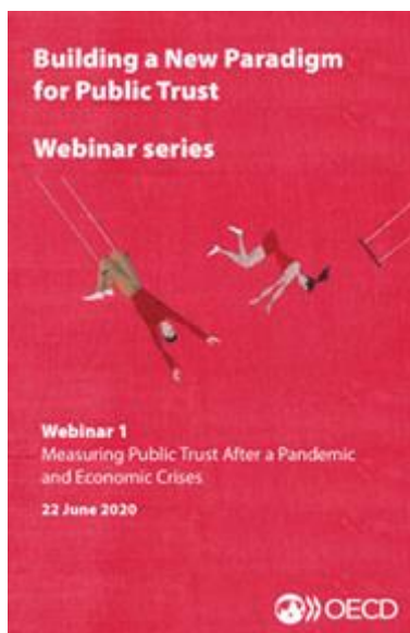
Webinar: Measuring public trust after a pandemic and economic crises