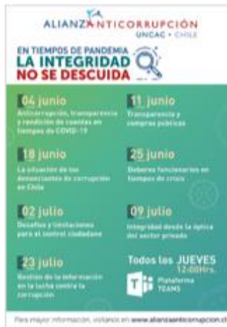
Alianza Anticorrupción – UNCAC – Chile – Webinars 2020