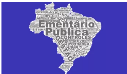
Ementário de Gestão Pública nº 2.115 23/02/2018 Em "Boletim"