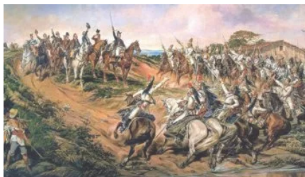
EMENTÁRIO DE GESTÃO PÚBLICA nº 1.907 25/03/2017 Em "Boletim"