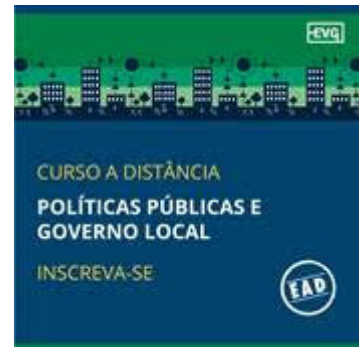
Curso EAD – Políticas Públicas e Governo Local