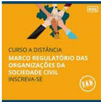
Curso EAD – Marco Regulatório das Organizações da Sociedade Civil