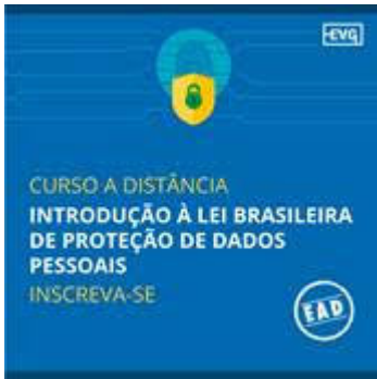
Curso EAD – Introdução à Lei Brasileira de Proteção de Dados Pessoais