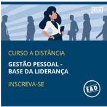
Curso EAD – Gestão Pessoal – Base da Liderança