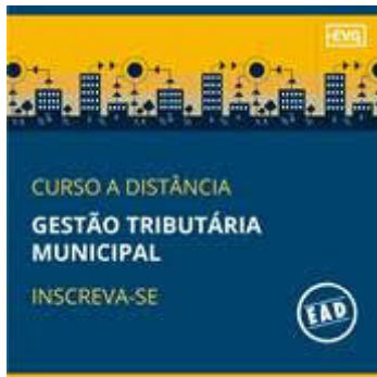
Curso EAD – Gestão Tributária Municipal