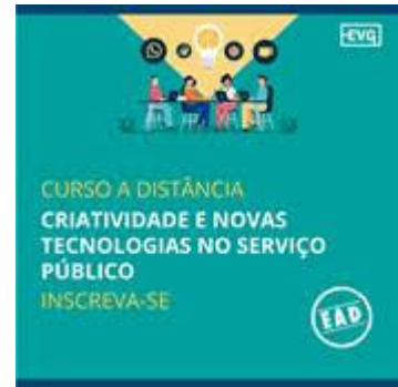
Curso EAD – Criatividade e Novas Tecnologias no Serviço Público