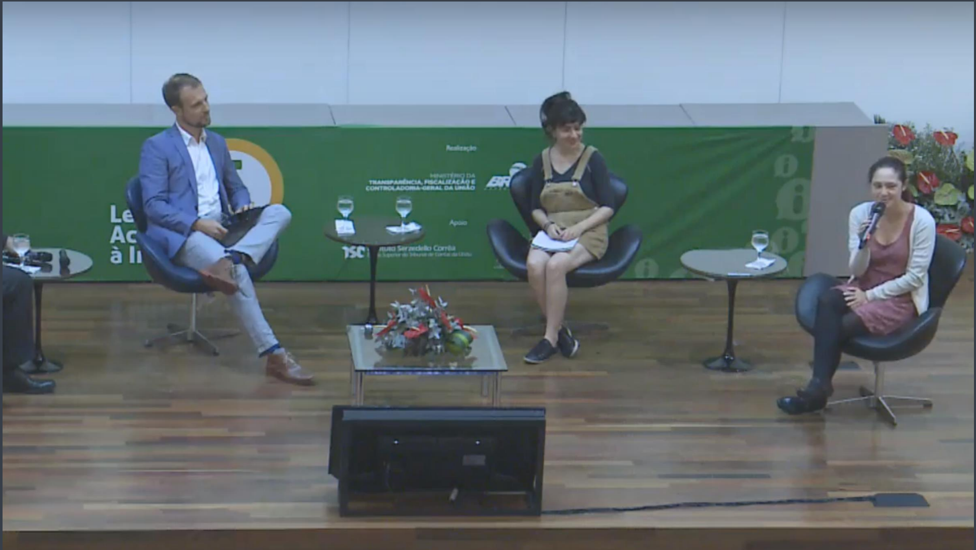
Civil society sharing experiences in an event for 300 public organizations